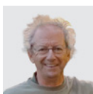
Jacques Bonneau Auteur