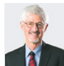
Robert Marquis Auteur

Ce roman historique à saveur autobiographique fait revivre l'aventure scientifique et humaine hors du commun qu'a représenté le programme Grand Nord. Au tournant du XXI e siècle, l'expertise géologique du Québec s'est mobilisée autour de l'ambition de recueillir le maximum de données inscrites dans les assises rocheuses du Nunavik. L'histoire fascinante racontée par ces pierres remonte à l'aube de la naissance du monde. Les péripéties et les rebondissements qui abondent dans ce récit mettent aussi en valeur le travail colossal réalisés par des artisans de l'ombre dont on entend trop peu parler.